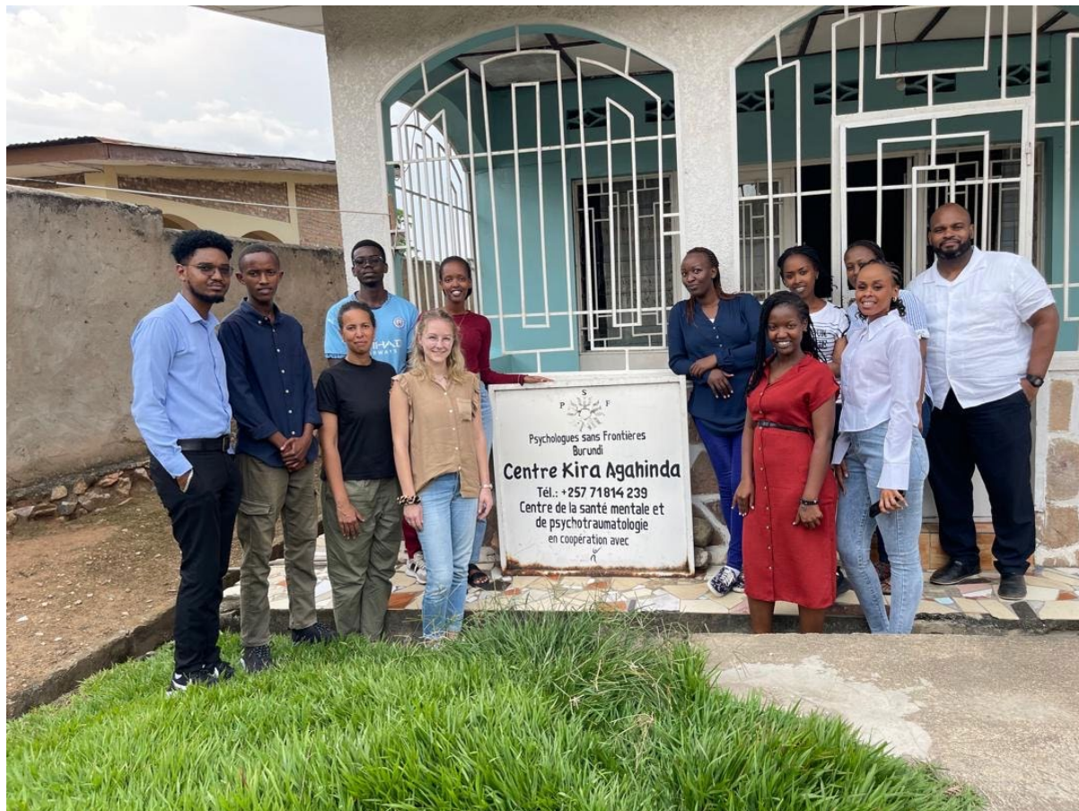
L'équipe de Psychologues Solidaires pour le Futur du Burundi lors d'un atelier de préparation du projet 2025.

Le projet commun de vivo international e.V. et Psychologues Solidaires pour le Futur du Burundi (PSF) soutient 60 jeunes victimes de violence et de pauvreté ainsi que leurs familles dans les quartiers défavorisés de Bujumbura. L'accompagnement psychologique et les conseils éducatifs visent à réduire le risque de récidive, à promouvoir les compétences sociales et à améliorer l'accès à l'éducation. À cette fin, 10 travailleurs sociaux des « Centres de Développement Familial et Communautaire » ont été formés à la reconnaissance des maladies mentales et à l'orientation des personnes concernées. En outre, des psychologues locaux de PSF ont proposé des interventions aux jeunes concernés, dont 31 mesures préventives et 15 thérapies traumatologiques. Un programme de groupe régulier a également été mis en place et PSF a effectué des visites familiales afin de renforcer les compétences parentales et de prévenir la maltraitance des enfants et les conflits familiaux. De plus, les familles ont reçu une aide financière afin de garantir la scolarisation des enfants et de leur permettre d'accéder à une assurance maladie basique.