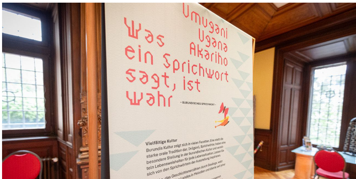
L'exposition AMAHORO! incite à la réflexion et invite à adopter de nouvelles perspectives