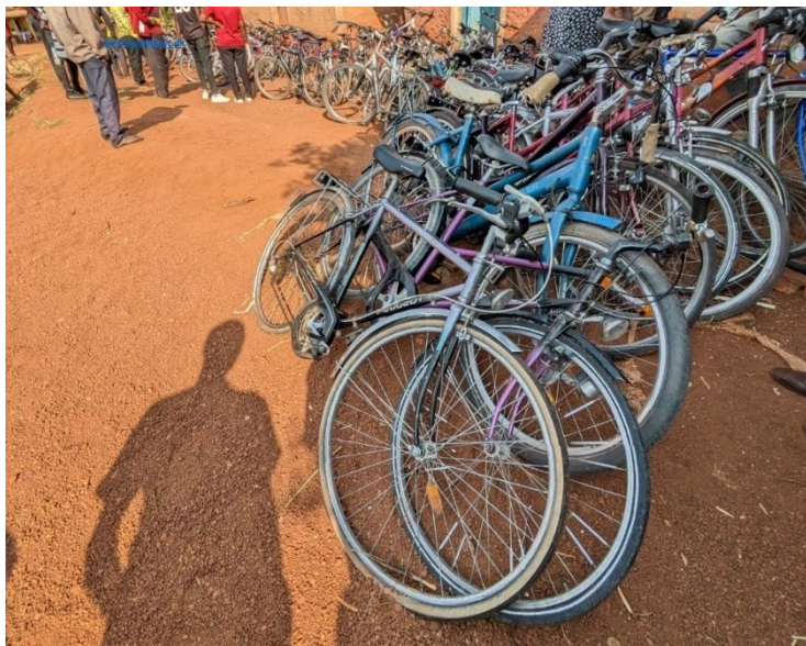
Le projet a distribué des vélos à Bubanza et Kirundo

Les 22 et 23 juillet 2025, la Fondation Charles Nkazamyampi (FCN), en coopération avec Anstoß zur Hoffnung e.V., a distribué une centaine de vélos à de jeunes bénéficiaires dans les communes de Bubanza (Mpanda) et Kirundo (Kigoma). Cette action s'inscrit dans le cadre de l'initiative de promotion de la jeunesse et de coopération au développement.