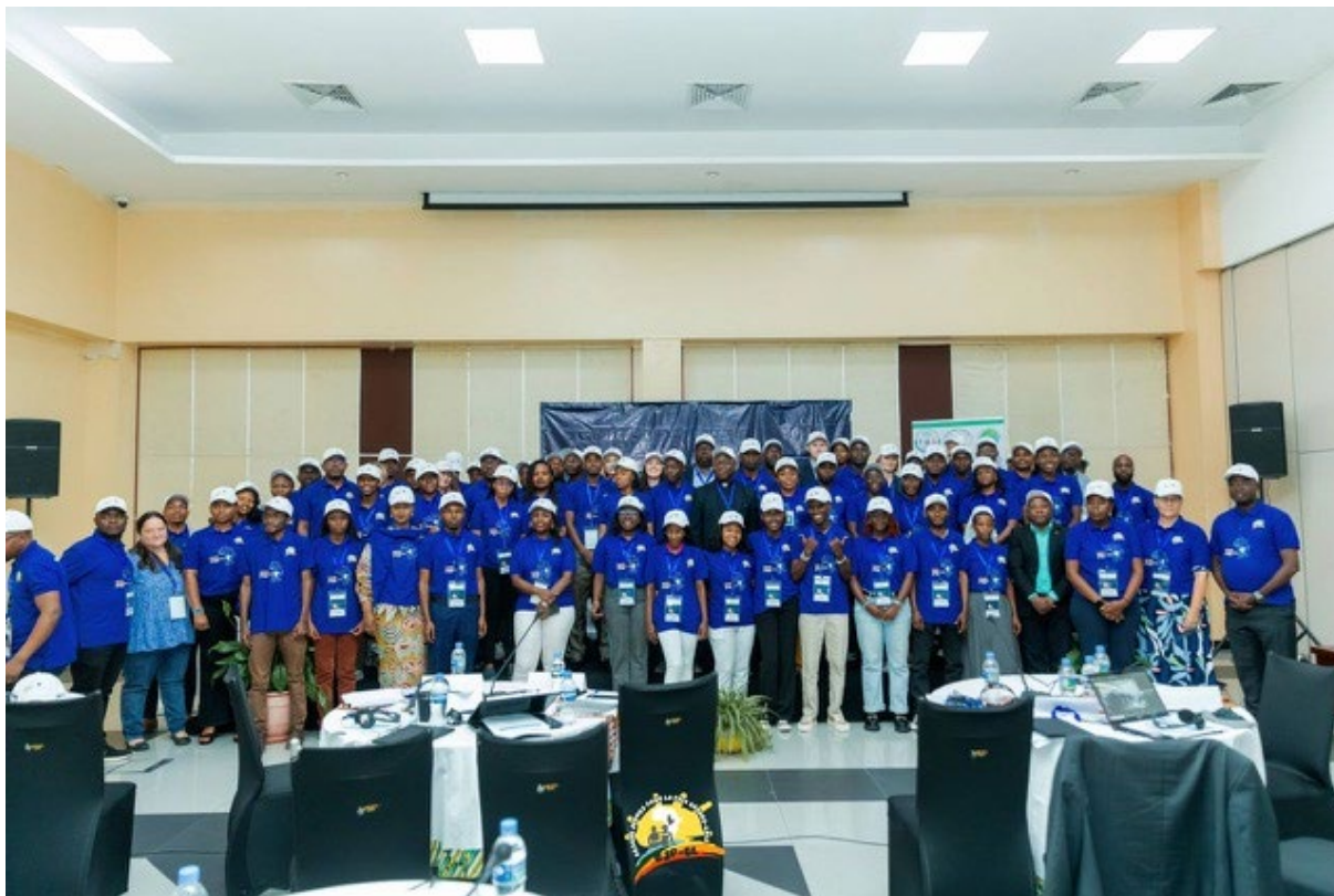
Colloque régional « Les jeunes pour la paix » en 2025 à Kigali, Rwanda