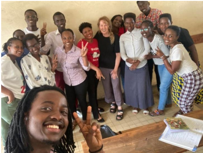
Enseignants d'allemand en mission à Bujumbura via le SES.