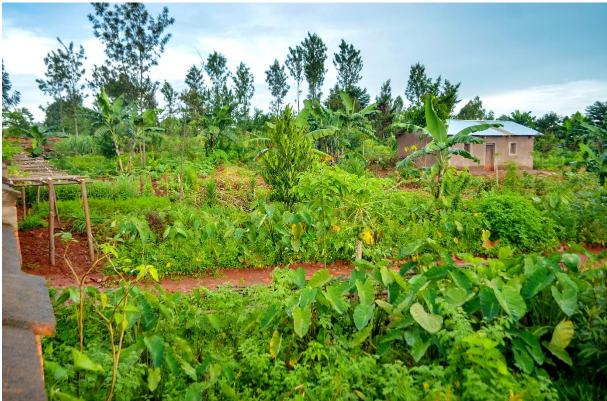
Culture intercalaire sur le site du projet du centre d'éducation et de formation agro-social

Pour plus d'informations, veuillez cliquer ici.