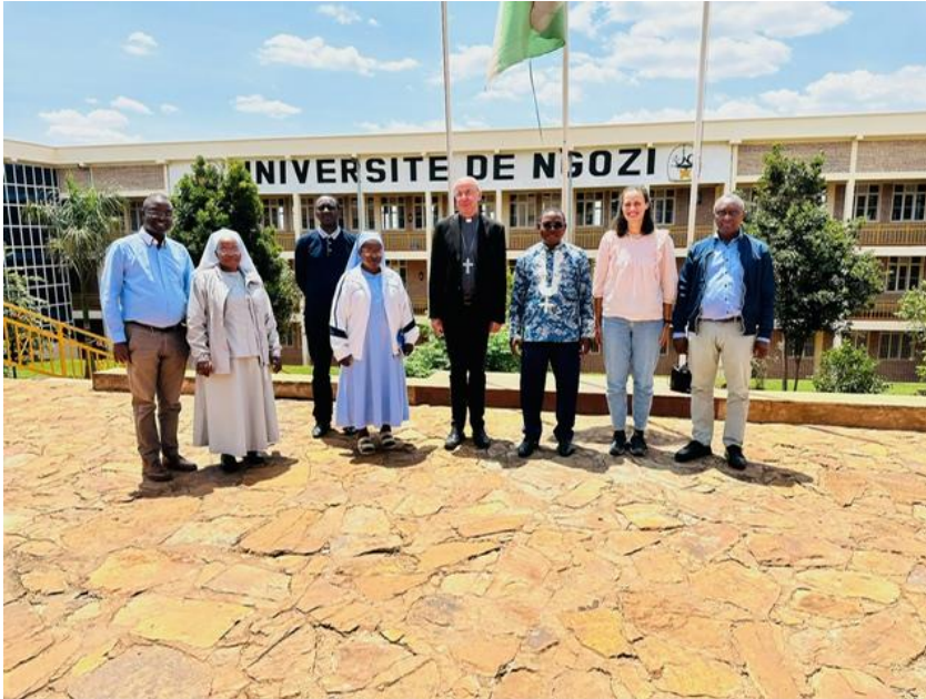
Le Cluster Paix visite l'Université de Ngozi