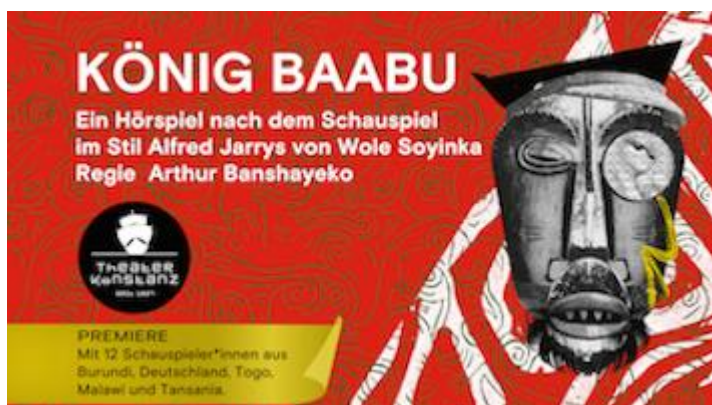
Illustration : Avec l'aimable