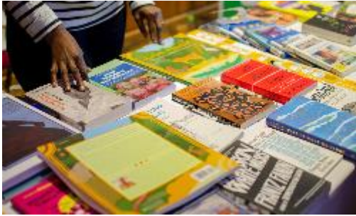
Stand au Forum Afrique BW