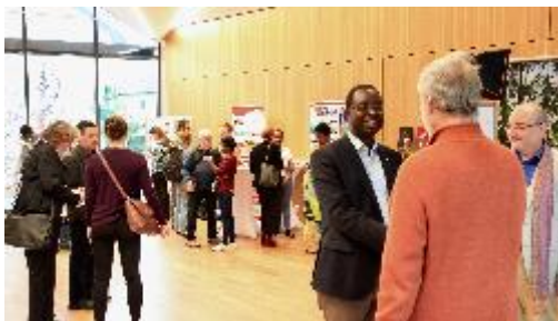
Échanges animés lors du marché de la Conférence BW-Burundi 2022