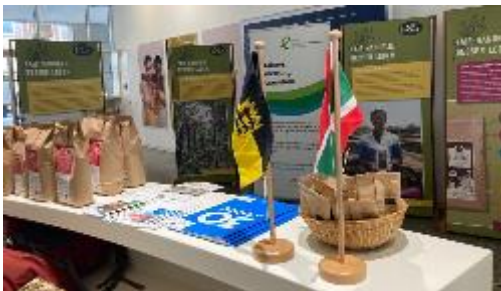
La SEZ était représentée par un stand lors du lancement