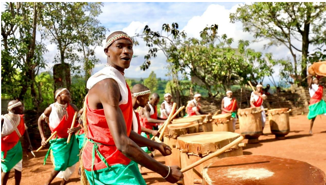
Les Tambourinaires du Burundi font partie du patrimoine culturel mondial de l'UNESCO depuis 2014.