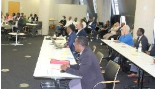
Participants écoutant attentivement lors du symposium